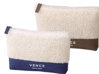
「VENCE share style」限定ノベルティ