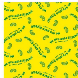
↑進呈するバンダナ

当日は、当社従業員も参加し、小児がんへの理解と周知を広げるためにウォーキングを行ないます。