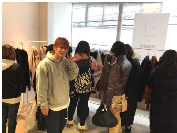
↑じゅんきさん（グレーパーカー）とファンの方々