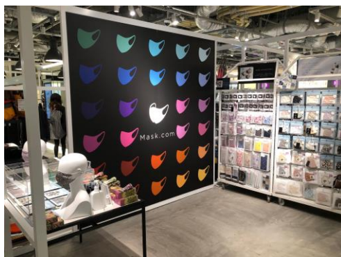
↑記念写真が撮影できる、オリジナルパネル