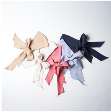
↑ファッションに合わせて選べる5色