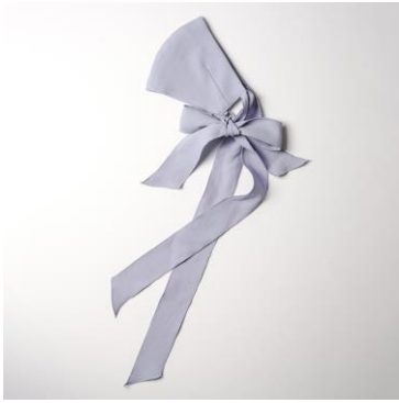
↑ボリュームのあるリボンが顔周りを華やかにします。