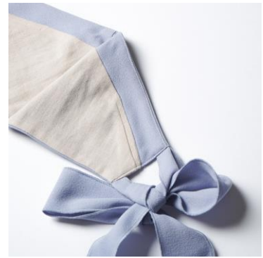
↑口元は綿100%を使用し、お肌に優しいタッチ。

マスクの購入はこちらでも！公式オンラインストア「TOKYO DESIGN CHANNEL」